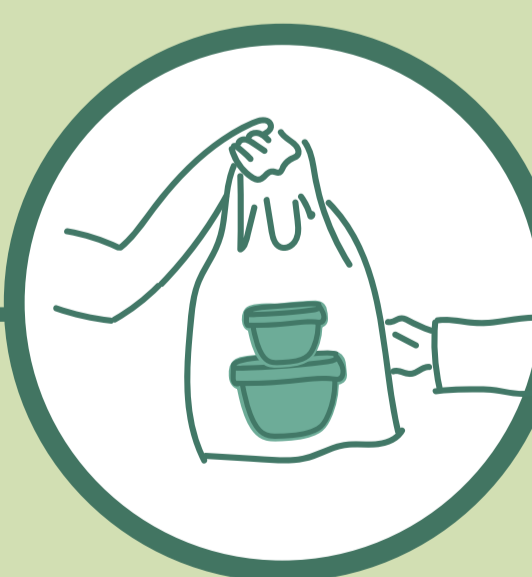
2. MEGLOOのリユース容器でテイクアウト