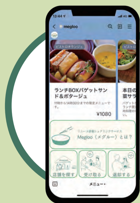
1. 注文時にLINEで容器の貸出登録