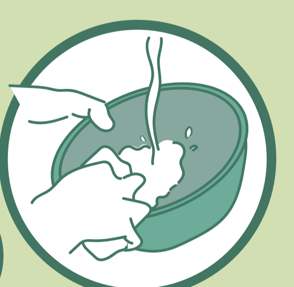
4. 店舗で洗って再利用

容器は、地域の参加店舗でシェア。 返却は、どこでも可能です。 地域のゴミは、地域で減らします。