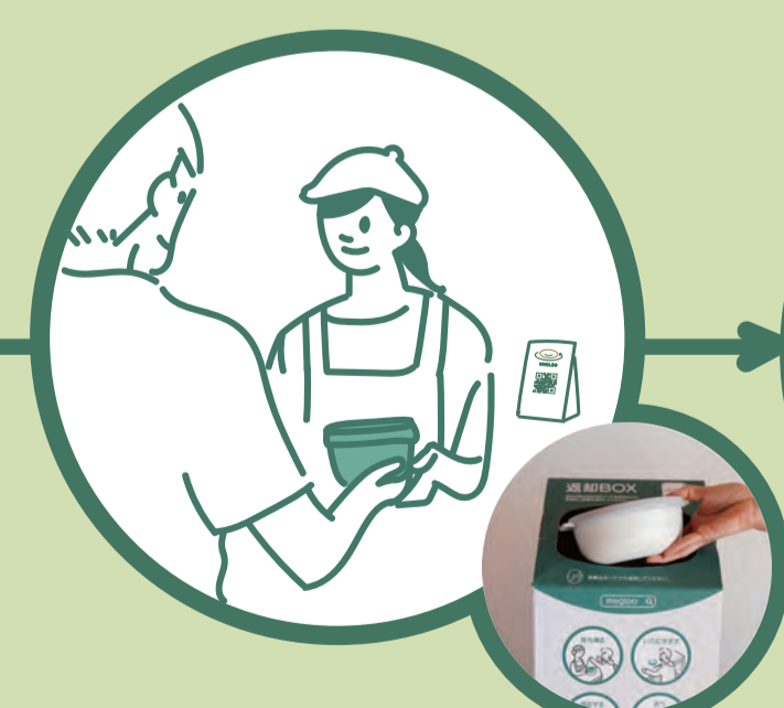
3. お近くの対応店舗で返却